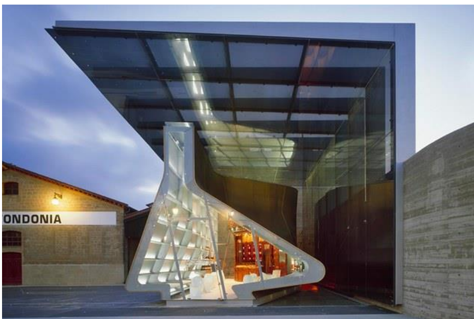
17/19 R. López de Heredia (Rioja, Spain) lopezdeheredia.com