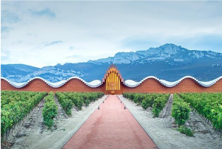
6/19 Bodegas Ysios (Spain). domecqbodegas.com

Vinariju Bodegas Ysios , u španskoj regiji Rioja, dizajnirao je Santiago Calatrava i završio 2001. godine, sa valovitim krovom od aluminija i kedra koji odjekuje planinskim pejzažom. Ime vinarije je poštovanja prema Isis i Osiris, egipatskim bogovima usko vezanim za svijet vina.