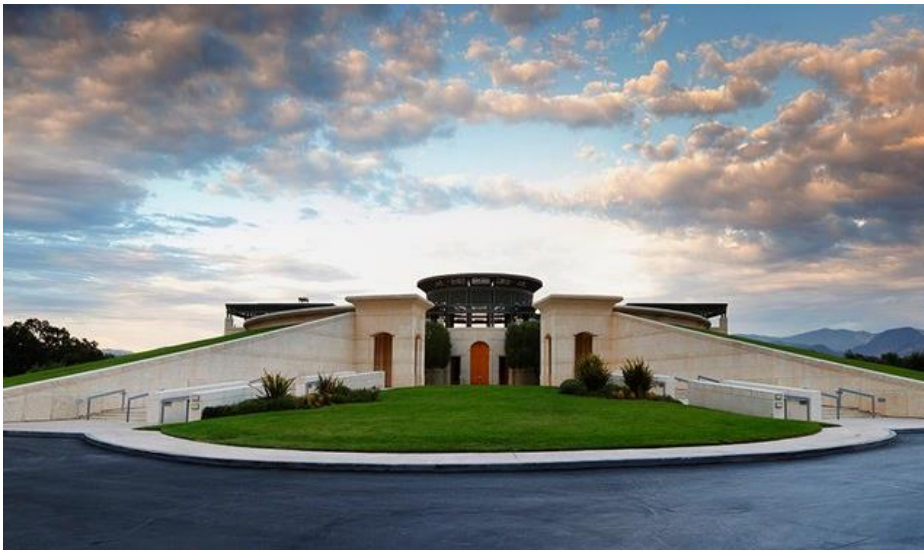
15/19 Opus One (Napa Valley, California) opusonewinery.com

Smještena u Ribera del Duero, jednoj od najistaknutijih španskih regija za proizvodnju vina, vinarija Bodegas Portia , dio je grupe Faustino, dizajnirana od strane Foster + Partners i otvorena 2010. Uz mnoge moderne elemente dizajna (Cor-Ten čelični vanjski zidovi, krov solarni paneli), struktura takođe uključuje staromodni sistem za proizvodnju vina sa gravitacijom: poslije berbe grožđe se istresa na krov, gdje se obrađuje; šira zatim odlazi do tankova koji čekaju ispod.