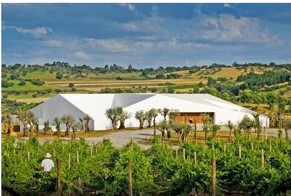
9/19 L'And Vineyards (Montemor-o-Novo, Portugal). l-andvineyards.com

Vinarija Petra , smještena u blizini drevnog toskanskog sela Suvereto, dizajnirana je od strane švicarskog arhitekta Mario Botta i dovršena 2003. Struktura ima arhitektonska obilježja koja podsjećaju na druge Botta dizajne, uključujući cilindrično jezgro (kao što se vidi u Muzeju moderne umjetnosti, San Francisco) i na vrhu krov zasađen biljkama (sličan krovu katedrale vaskrsnuća (Évry, Francuska), ali zgrada je čvrsto ugrađena u regiju, sa vanjskim pokrovom od grubog ružičastog kamena iz Verone.