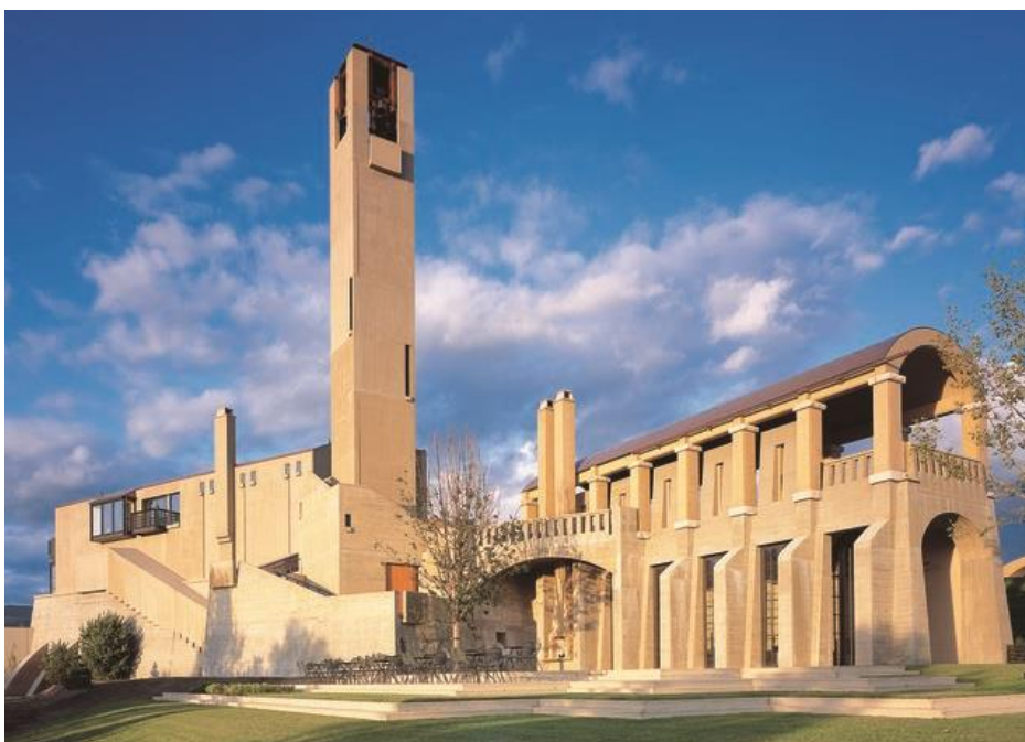
5/19 Mission Hill Winery (West Kelowna, Canada) missionhillwinery.com

Nedavno je u vinogradarskom regionu Stellenbosch u Južnoj Africi sagrađena i vinarija Kunjani . Dizajn vinarije stavlja moderan pogled u Cape Dutch arhitekturu sa svojim eksterijerom od uglja i crvenim kliznim ekranima, koji su inspirisani obrascima oslikanim na zapadnoafričkim kolibama od blata. Interijeri, Haldane Martin, podjednako su odvažni sa laserskim rezanjem stepenica i prikaza vina, grafičkim tapetama sa jarko crvenim akcentima.