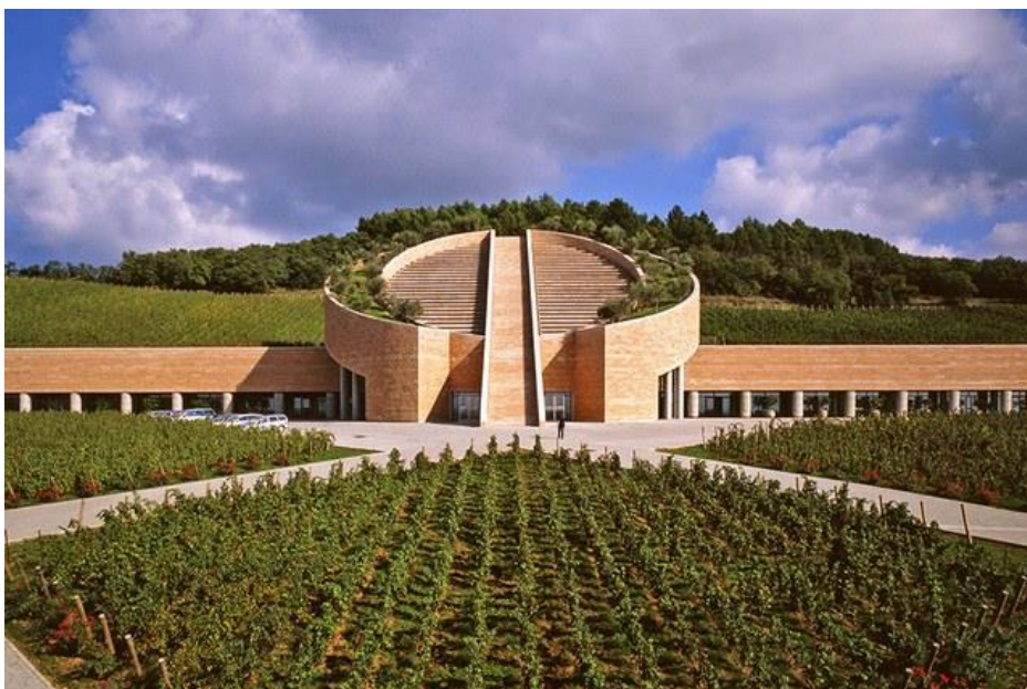
8/19 Petra Winery (Suvereto, Italy) petrawine.it

Vinarija Petra , smještena u blizini drevnog toskanskog sela Suvereto, dizajnirana je od strane švicarskog arhitekta Mario Botta i dovršena 2003. Struktura ima arhitektonska obilježja koja podsjećaju na druge Botta dizajne, uključujući cilindrično jezgro (kao što se vidi u Muzeju moderne umjetnosti, San Francisco) i na vrhu krov zasađen biljkama (sličan krovu katedrale vaskrsnuća (Évry, Francuska), ali zgrada je čvrsto ugrađena u regiju, sa vanjskim pokrovom od grubog ružičastog kamena iz Verone.