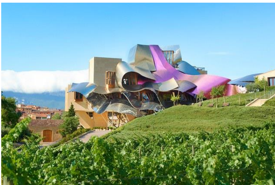
11/19 Marqués de Riscal ( Elciego, Spain ). marquesderiscal.com

Vinariju Niepoort , u portugalskoj dolini Douro, dizajnirao je austrijski arhitekt Andreas Burghardt, a završio ju je 2008. godine. Stepenice, zakrivljene linije kamenih fasada odražavaju terasasti predio vinograda.