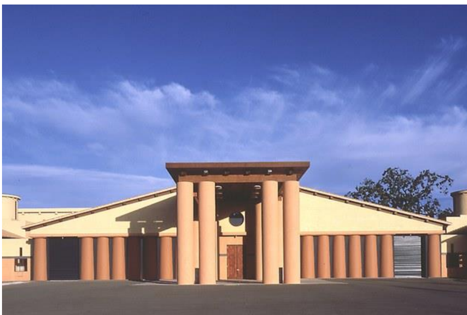
13/19 Clos Pegase Winery (Calistoga, California) clospegase.com

Vinarija O. Fournier (Mendoza, Argentina), dizajnirana je od Bormida & Yanzon i dovršena 2007. Moderna konstrukcija od betona, stakla i nerđajućeg čelika u velikom je reljefu na spektakularnoj pozadini valovitih planina koje strše ravno iz vinograda.