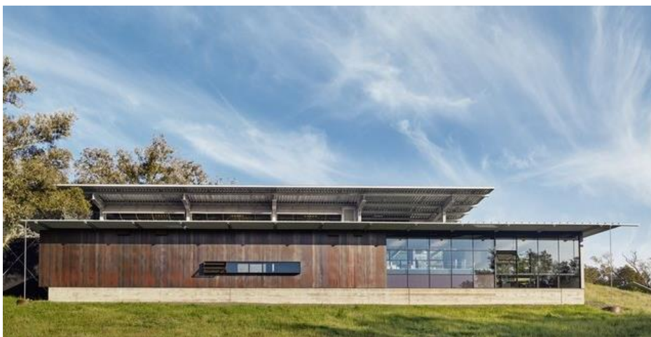
2/19 Epoch Estate Wines (Templeton, California) epochwines.com

Za vinariju Epoch Estate , Lake | Flato arhitekta su dizajnirali proizvodni pogon koji se uklapa u pejzaž lokacije Yorka Mountain. Objekt sa čeličnim okvirom veličine 1.580 kvadratnih metara ima prostor za fermentaciju na otvorenom kako bi se iskoristile hladne noćne temperature. Svodna prostorija je izrađena od betonske ploče i dramatično je osvijetljena sa dva kružna otvora. Prostorija za degustaciju je postavljena u bivšoj Vinariji na planini York, koja je bila napuštena nakon zemljotresa 2003. godine. Arhitekta Brian Korte sačuvao je izvorne grede crvenog drveta i iskoristio kamene ploče iz originalnog podruma u revitalizaciju zgrade.