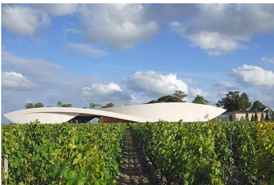
19/19 Château Cheval Blanc (Saint-Émilion, France) chateau-cheval-blanc.com

Hotelijeri Alex i Carrie Vik bili su domaćini takmičenja čileanskih arhitekata u 2007. godini za komisiju za izradu novog dizajna za vinariju Vik . Smiljan Radić je uzeo nagradu i stvorio dugačku, nisku zgradu u središtu nekretnina od 4.450 hektara u dolini Millahue, južno od Santiaga. Radić, koji je dizajnirao ovogodišnji Serpentine paviljon u Londonu, zadržao je profil zgrade nenametljiv stvaranjem podzemnih nivoa za preradu i čuvanje vina. Ekspanzivni plitki bazen koji drži vodu za hlađenje nižih nivoa je ispresijecan betonskim stazama i ukrašen kamenjem.