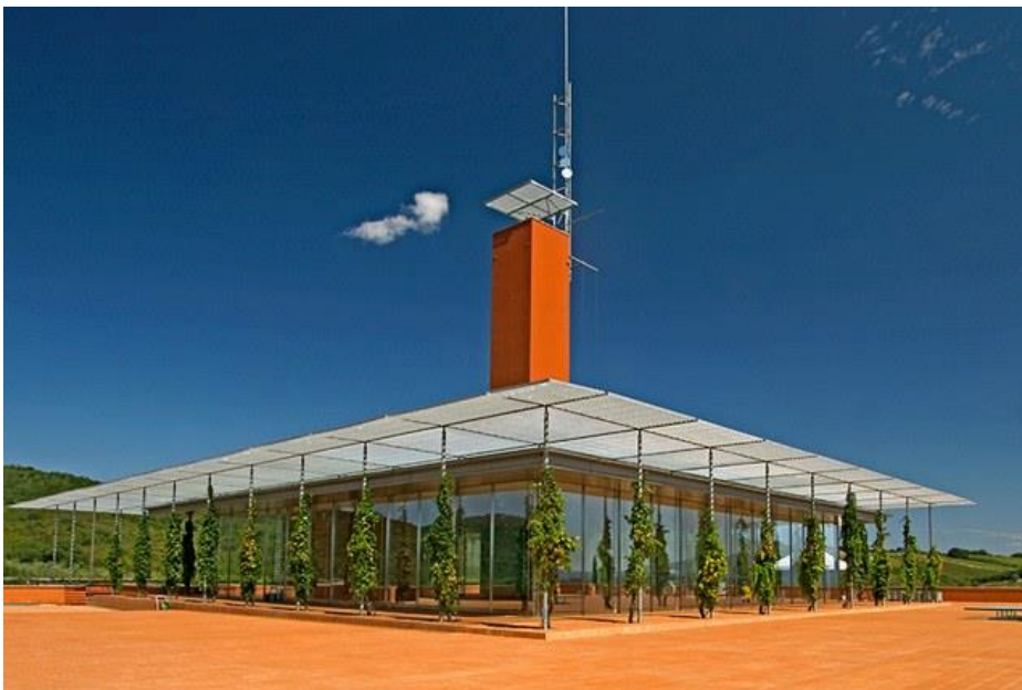
7/19 Photo: Andrea Rontini. Rocca di Frassinello (Maremma, Italy). castellare.it

Vinariju Bodegas Ysios , u španskoj regiji Rioja, dizajnirao je Santiago Calatrava i završio 2001. godine, sa valovitim krovom od aluminija i kedra koji odjekuje planinskim pejzažom. Ime vinarije je poštovanja prema Isis i Osiris, egipatskim bogovima usko vezanim za svijet vina.