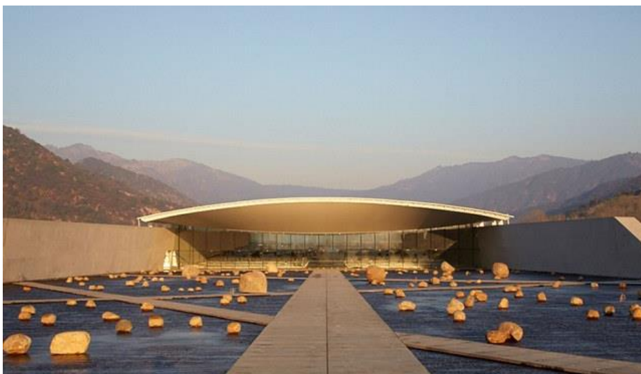
18/19 Vik (Millahue Valley, Chile). vik.cl