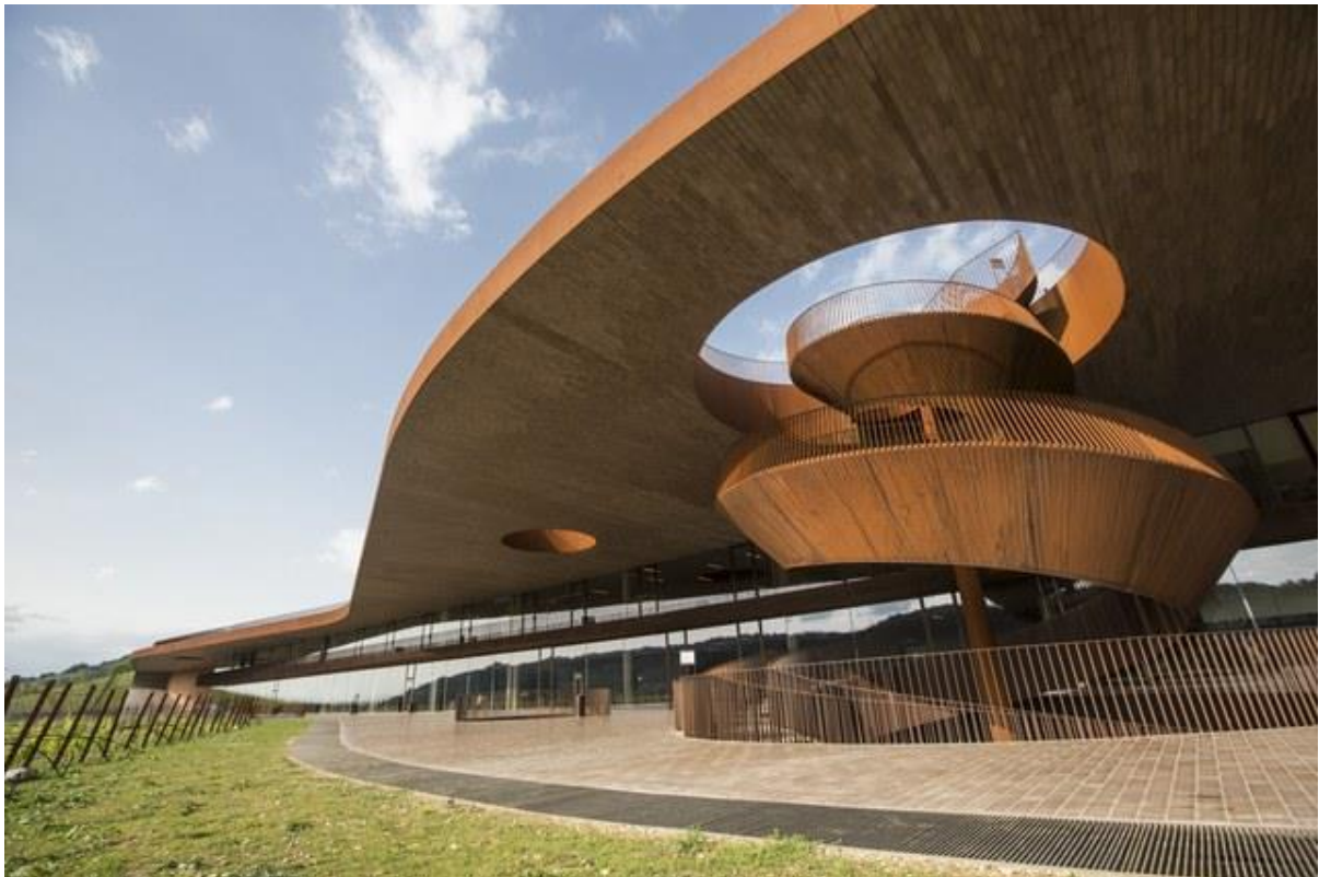
1/19 Antinori nel Chianti Classico (Bargino, Italy) antinori.it

Posljednjih godina sve više i više najboljih vinarija nastojalo je privući pažnju ne samo svojim vinima, nego i dizajnom svojih objekata, a zvijezde arhitekta od Renzo Piano do Zaha Hadid. To znači da vinarije više nisu samo obična stajališta na putu ka glavnoj atrakciji - oni su same postale destinacije. Vrhunska hrana i piće, zadivljujuća arhitektura, luksuzni smještaj, idilična atmosfera - od toga su napravljeni epikurejski snovi. Prije berbe grožđa (barem na sjevernoj hemisferi), AD (ArchitecturalDigest) razmatra neke od najljepše dizajniranih vinarija širom svijeta. In vino - i venustas - verities.