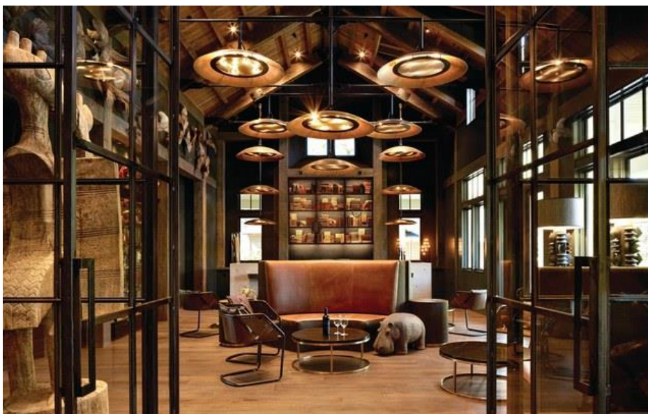
3/19 Trinchero Napa Valley (Napa Valley, California) trincheronapavalley.com

Za vinariju Epoch Estate , Lake | Flato arhitekta su dizajnirali proizvodni pogon koji se uklapa u pejzaž lokacije Yorka Mountain. Objekt sa čeličnim okvirom veličine 1.580 kvadratnih metara ima prostor za fermentaciju na otvorenom kako bi se iskoristile hladne noćne temperature. Svodna prostorija je izrađena od betonske ploče i dramatično je osvijetljena sa dva kružna otvora. Prostorija za degustaciju je postavljena u bivšoj Vinariji na planini York, koja je bila napuštena nakon zemljotresa 2003. godine. Arhitekta Brian Korte sačuvao je izvorne grede crvenog drveta i iskoristio kamene ploče iz originalnog podruma u revitalizaciju zgrade.