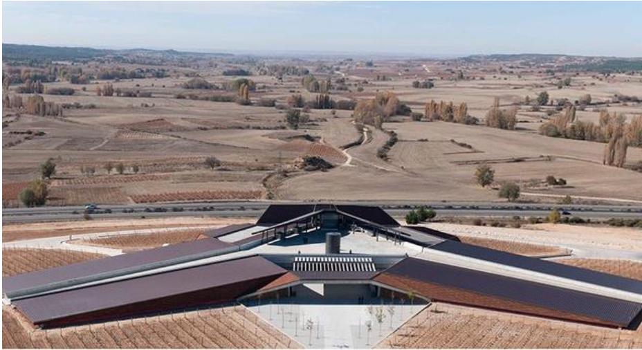
14/19 Photo: Nigel Young. Bodegas Portia (Ribera del Duero, Spain). bodegasfaustino.com

Smještena u Ribera del Duero, jednoj od najistaknutijih španskih regija za proizvodnju vina, vinarija Bodegas Portia , dio je grupe Faustino, dizajnirana od strane Foster + Partners i otvorena 2010. Uz mnoge moderne elemente dizajna (Cor-Ten čelični vanjski zidovi, krov solarni paneli), struktura takođe uključuje staromodni sistem za proizvodnju vina sa gravitacijom: poslije berbe grožđe se istresa na krov, gdje se obrađuje; šira zatim odlazi do tankova koji čekaju ispod.