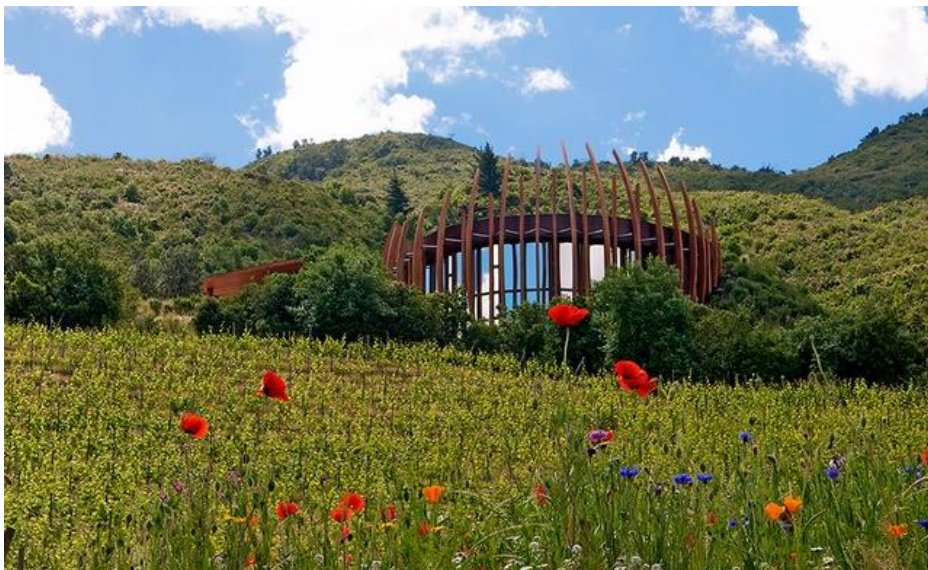
16/19 Lapostolle Clos Apalta (Colchagua Valley, Chile) en.lapostolle.com

Godine 1994. Alexandra Marnier Lapostolle, potomak francuske porodice za proizvodnju vina i alkohola koji proizvodi Grand Marnier, i njen suprug Cyril de Bournet, počeli su uzgajati grožđe i proizvoditi vino u plodnoj čileanskoj dolini Colchagua. Deset godina kasnije, završili su centralnu vinariju na brdu iznad imanja. Vinarija Lapostolle Clos Apalta , dizajnirana od strane Amercanda Architects, je šestostepena struktura drveta, stakla i čelika koja izgleda kao ptičje gnijezdo smješteno na padini planine. Pored sadržaja za degustaciju, Lapostolle nudi i smeštajne kapacitete Relais & Châteaux.