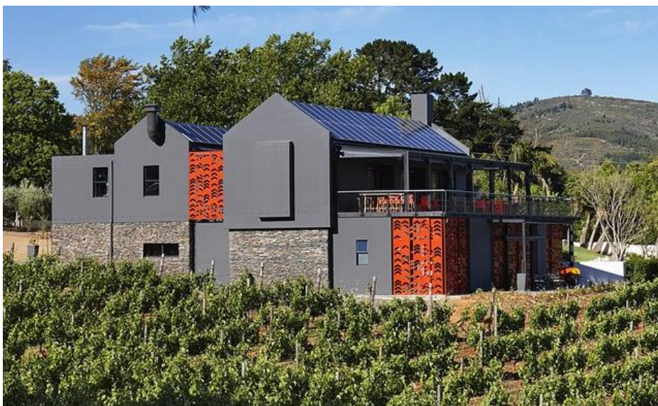
4/19 Photo: Courtesy of Haldane Martin. Kunjani Wines (Stellenbosch, South Africa). kunjaniwines.co.za

Nedavno je u vinogradarskom regionu Stellenbosch u Južnoj Africi sagrađena i vinarija Kunjani . Dizajn vinarije stavlja moderan pogled u Cape Dutch arhitekturu sa svojim eksterijerom od uglja i crvenim kliznim ekranima, koji su inspirisani obrascima oslikanim na zapadnoafričkim kolibama od blata. Interijeri, Haldane Martin, podjednako su odvažni sa laserskim rezanjem stepenica i prikaza vina, grafičkim tapetama sa jarko crvenim akcentima.